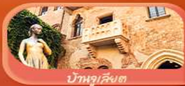
บ้านลูเลียงต

เวนิส มิลาน เวโรนา ซูริก ลูเซิร์น โลซาน เซอร์แมท