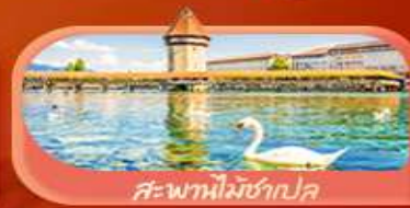
สะพานไม้ซังปก

Highlight เยือนหมู่บ้านแสนสวยเซอร์แมท เช็กอินศาลาไทยสุดงามที่โลซาน เกี่ยวลูเซิร์น ชมสะพานไม้ซังและอนุสาวรีย์สิงโต ซาลิ แอปลิน ชมประติมากรรม The Fork และปราสาทซิลลองริมทะเลสาบ เยือนมิลาน มหาวิหารดูโอโม เที้ยวเวนิส เมืองลอยน้ำสุดโรแมนติก อินกับรักอมตะที่บ้านจูเลียต และช้อปปิ้งจุใจที่ Serravalle Outlet