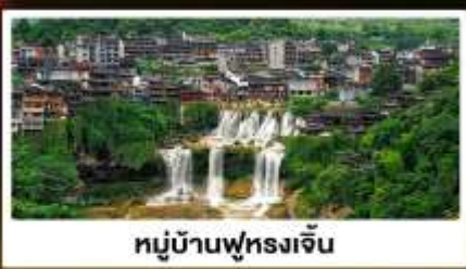
หมู่บ้านฟุทงเจิน