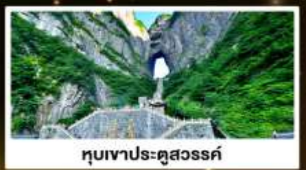
ทิวเขาประตูสวรรค์