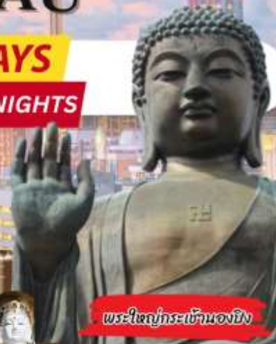
พระใหญ่กระเช้านองยี่ง