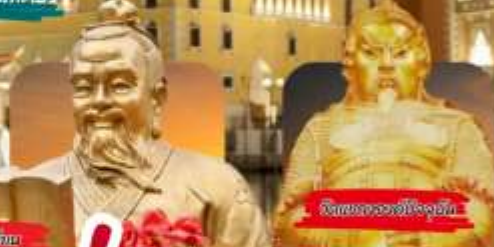
วัดของชาวฮกเกี้ยน