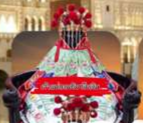
ประเพณีฮกเกี้ยน