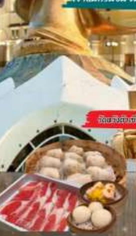
วัดของฮกเกี้ยน