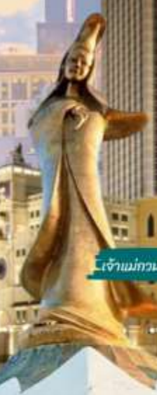
เจ้าแม่กวนอิม ริมทะเล