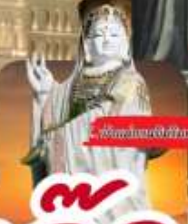
เทพนิรมิต