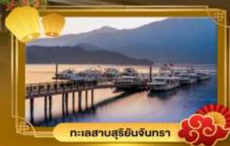
ทะเลสาบสุริยอินจันตรา