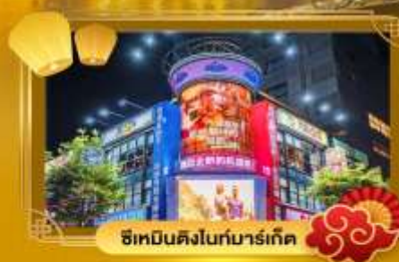
ช้อปปิ้งดิงโถกมาร์เก็ต