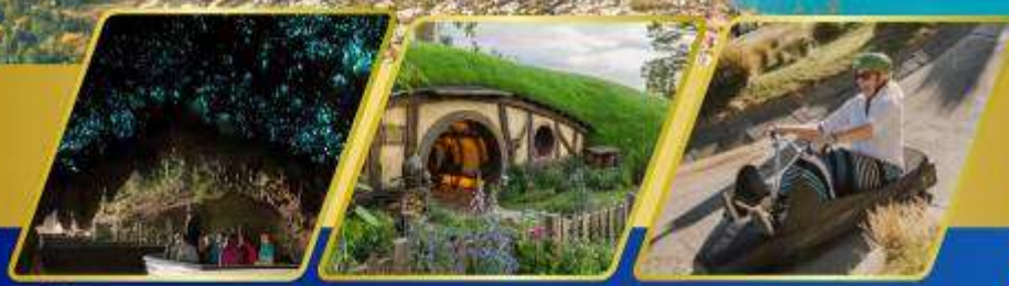
ถ้ำหอนเรื่องแสง หมู่บ้านฮ็อบบิต เล่นลู่ที่ควีนส์ทาวน์

AUCKLAND / ROTORUA / CHRISTCHURCH FOX GLACIER / FRANZ JOSEF / QUEENSTOWN พักอ็อกแลนด์ 2 คืน / โรโตรัว 1 คืน / พักคริสตซ์เชิร์ช 2 คืน พักฟรานซ์โจเซฟ 1 คืน / ควีนส์ทาวน์ 2 คืน