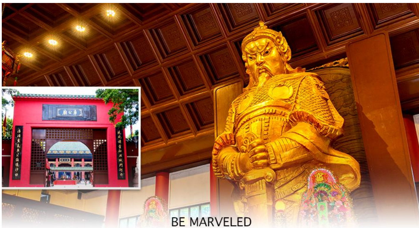
BE MARVELED วัดแชกง

นำท่านเดินทางสู่ วัดแชกงหมิว หรืออีกชื่อหนึ่งว่า “วัดกั๊กหันลม” หนึ่งในวัดดังของฮ่องกง ที่ประชาชนให้ความเลื่อมใสศรัทธามานาน ด้านในศาลจะมีรูปปั้นสูงใหญ่ของท่านแชกง ซึ่งเป็นเทพประจำวัดแห่งนี้ เชื่อ ว่าองค์ท่านศักดิ์สิทธิ์ในการขอพรด้านโชคลาภ เสริมความเป็นสิริมงคล ปิดเป่าเรื่องร้ายๆออกไป และวัดแห่งนี้ยังเป็น สถานที่ที่นิยมสำหรับท่านที่ต้องการแก้ปีชงอีกด้วย โดยวิธีการไหว้ขอพรจากท่านแชกงนั้น ท่านจะต้องเข้าไปยืนอยู่เบื้อง หน้ารูปปั้นของท่าน แล้วอธิษฐานขอพรพร้อมกับมองหน้าท่านอย่างมุ่งมั่นตั้งใจ จากนั้นให้ท่านทำพิธีหม้อน “กั๊กหันแห่ง โชคชะตา” หรือ “กั๊กหันนำโชค” เพื่อหม้อนรับแต่สิ่งดีๆ ให้เข้ามาในชีวิต