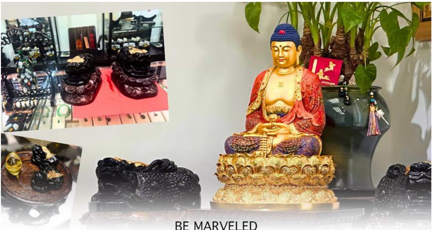
BE MARVELED ศูนย์ปีเซี่ยะ

และนำท่าน ชม ศูนย์ปีเซี่ยะ ซึ่งคนจีนนั้น ถือว่าหยกเป็นหิน ที่เป็นตัวแทนของความสวยงามและความบริสุทธิ์มีความเชื่อว่า หยก มงคล ถ้าพกติดตัวไว้จะอายุยืนและสุขภาพดีมีสินค้ำมากมายเกี่ยวกับหยก อาทิ กำไลหยก หรือสัตว์นำโชคอย่างปีเซี่ยะ ให้ ท่าน ได้เลือกซื้อเป็นของฝาก, ของที่ระลึก หรือของนำโชคแต่ตัวท่านเอง