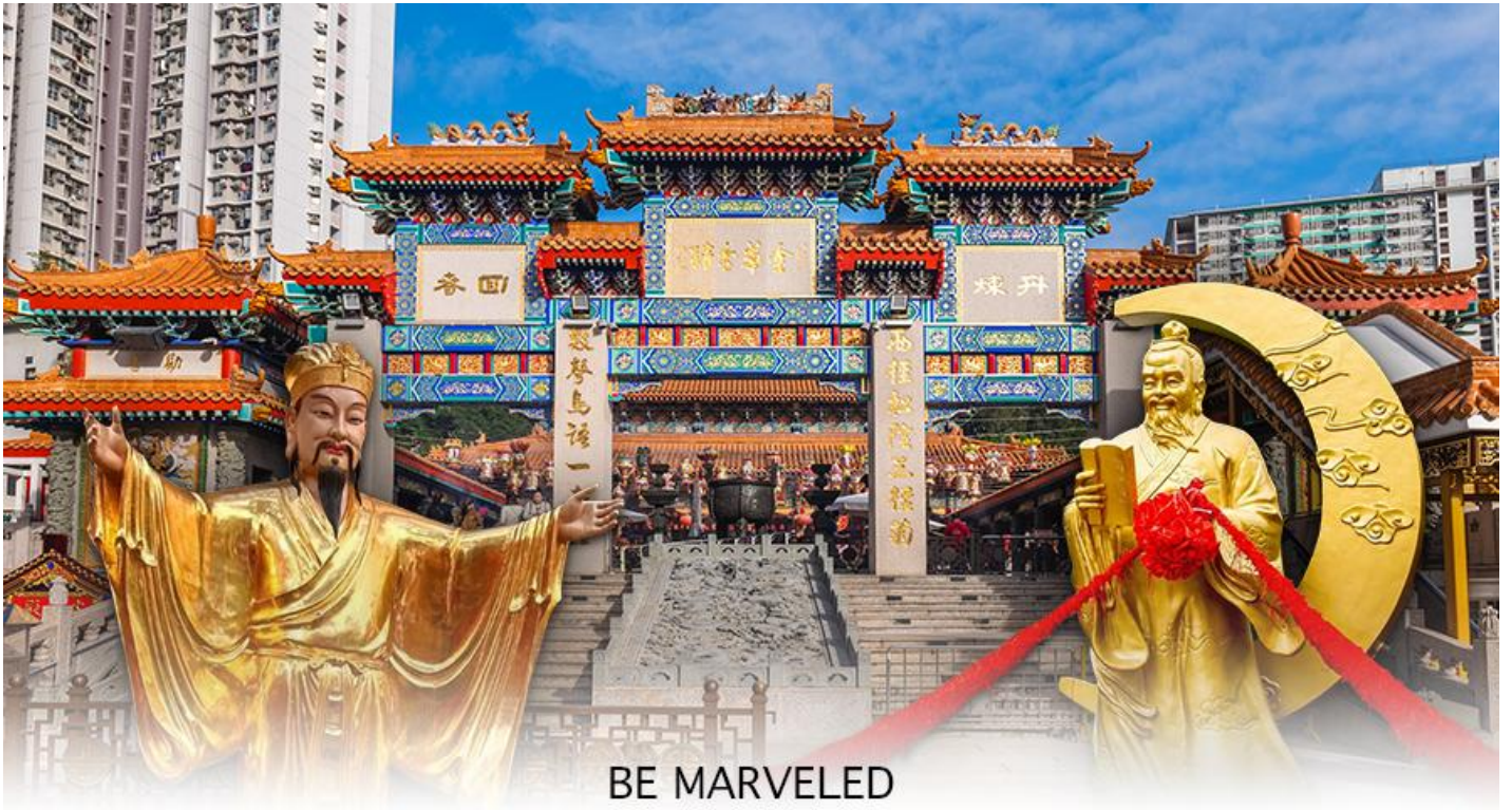
BE MARVELED วัดหวังต้าเซียน