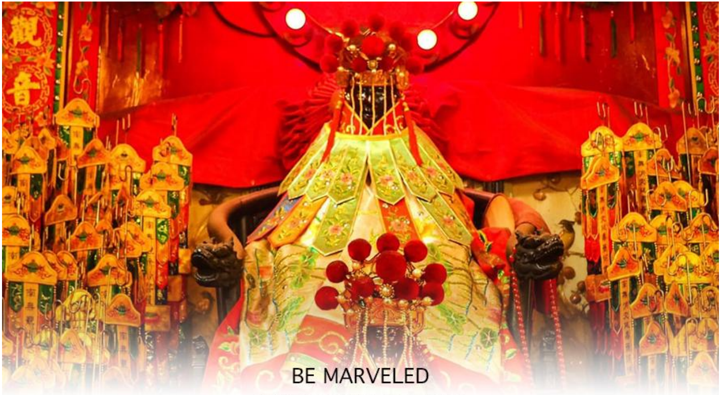
BE MARVELED วัดเจ้าแม่กวนอิมฮวงอ่า (ยิมจิน)

หลังวันตรุษจีน ไป 26 วัน จะเป็นวันเปิดทรัพย์ที่จัดขึ้นในทุกๆปี พิธีนี้จะมีเพียงครั้งปีละครั้งเท่านั้น เป็นวันสำคัญอีกวันที่คน หลังไหลมาไหว้ขอพรอย่างไม่ขาดสาย