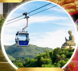
กระเช้าองปิง 360