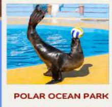
POLAR OCEAN PARK