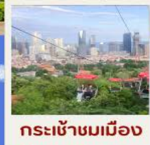
กระเช้าชมเมือง