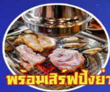
พร้อมเสิร์ฟปิ้งย่างเกาหลี