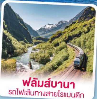
พลัมส์บานา รถไฟฟ้าเส้นทางสายโรแมนติก