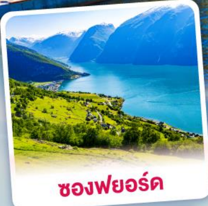
ช่องฟยอร์ด