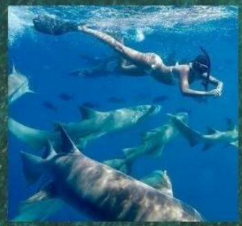
** Nurse Shark Snorkeling

จองด่วน ห้องมีจำนวนจำกัด Overwater Pool Villa