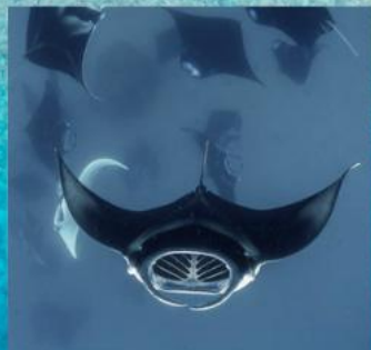
Manta Ray Snorkeling

Water Villa 3 DAYS 2 NIGHTS STARTING 40,000 THB/ PERSON