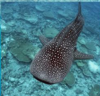
Whale Shark Snorkeling