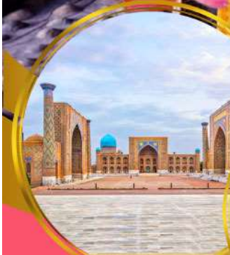
จัตุรัสเรอิสถาน